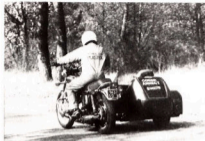
Le Jewell, un side de grand tourisme assez révolutionnaire conçu pour satisfaire les plus exigeants.